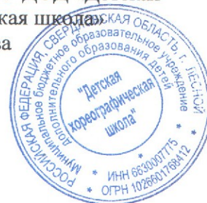
График образовательного процесса МБОУ ДОД «Детская хореографическая школа» на 2015 – 2016 учебный год

Начало учебного года – 1 сентября Окончание учебного года для учащихся 1 класса – 25 мая Окончание учебного года для учащихся 2 – 8 классов – 31 мая Количество учебных недель для учащихся 1 класса – 32 Количество учебных недель для учащихся 2 – 6 классов – 35 Количество учебных недель для учащихся 7 – 8 классов (с учётом аттестации) – 35